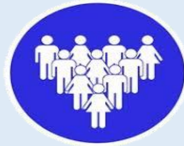
Dix personnes maximum par chambre