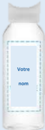
Identifier votre bouteille d'eau