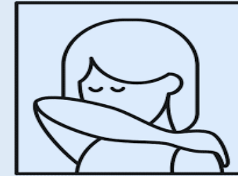
Tousser dans son coude